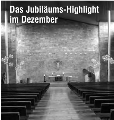
Das Jubiläums-Highlight im Dezember