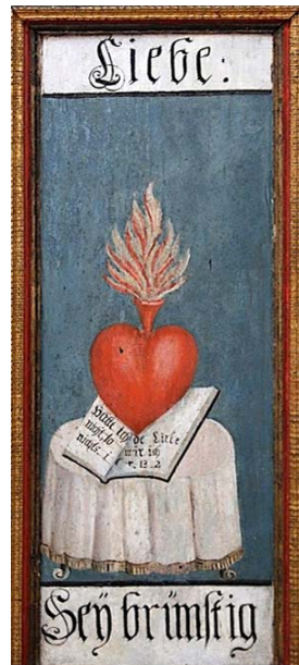
Tugendtafeln an der Kanzel in der evang. Kirche in Tartlau/Siebenbürgen