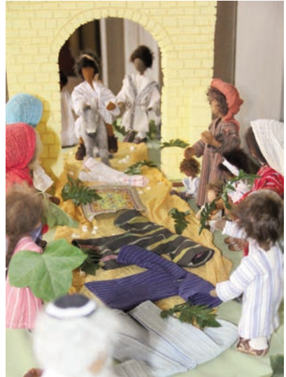
Einzug in Jerusalem