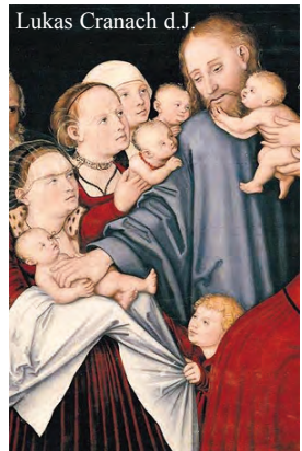
Jesus und die Kinder